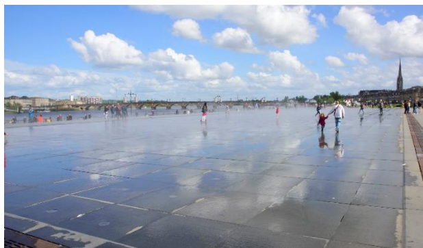
Le Miroir d'Eau