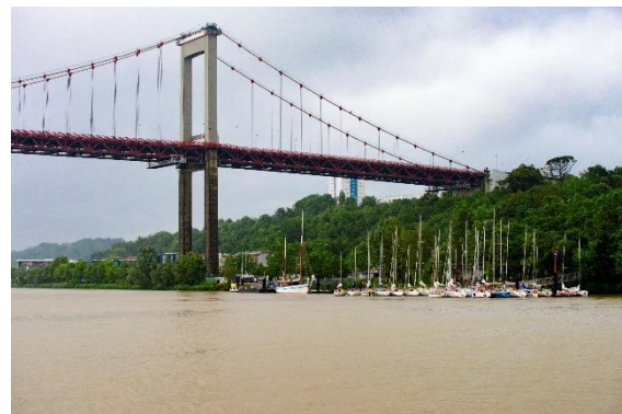
Le Pont d'Aquitaine