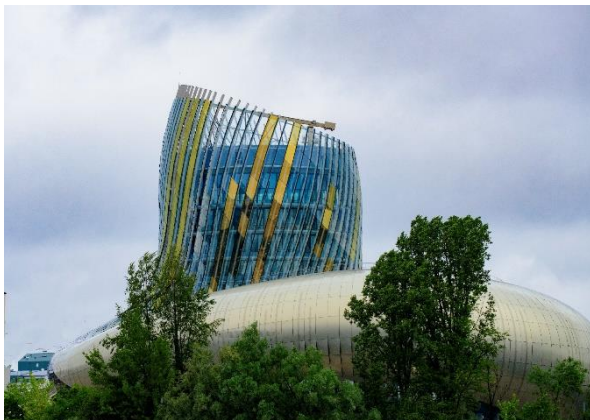
La Cité du Vin (même pas encore inaugurée)