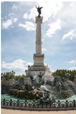
La Colonne des Girondins

Le midi, déjeuner au restaurant « La Belle Rose » à Lormont, juste sous le Pont d'Aquitaine. Ouvert le dimanche à midi, une super terrasse arborée au bord de la Garonne. Quand il fait beau, cela doit être très sympa. Nous n'avons pas eu l'occasion de nous en rendre compte. En tout cas, nous y avons bien mangé, c'était très bon.