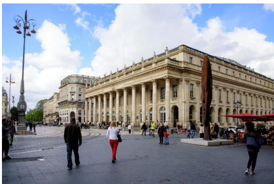
Le Grand Théâtre